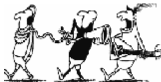
Novodobý prenosný walkmann