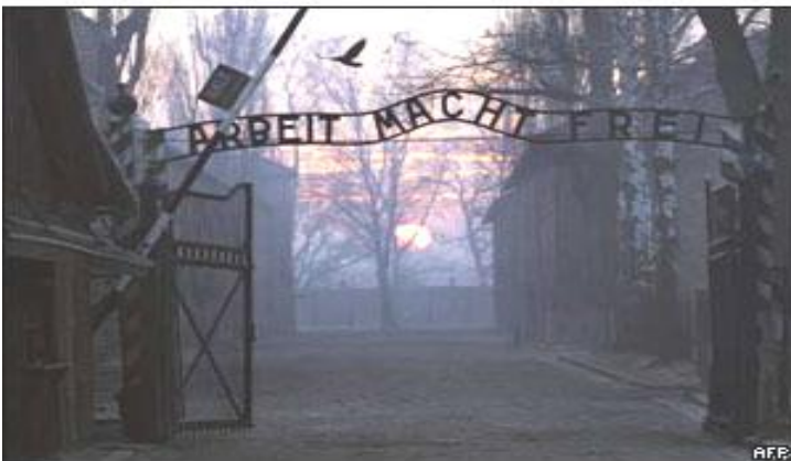
Nápis nad bránou tábora smrti – Práca oslobodzuje. Vpravo - Hore- ubytovne väzňov - Dole- Cyklón B s ktorým sa hromadne vraždilo v plynových komorách.

S odstupom času si ľudia na svete uvedomujú aké strašidelné veci sa tam diali, a som rada, že to už pominulo. Práve miesto, kde padlo množstvo obetí, by malo byť pre ostatných výstrahou, aby sa tu opäť tento zlý sen nezopakoval.