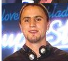
Robo Mikla 23 r. Žiar nad Hronom