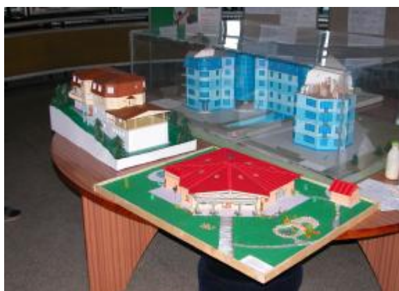
Takto vyzerali diela pred prezentáciou ...

Flaškár Andrej odbor: Biológia, ekológia-Modlivka zelená miesto: 1.