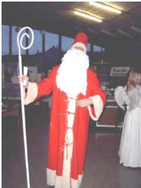
Mikuláš v plnej kráse