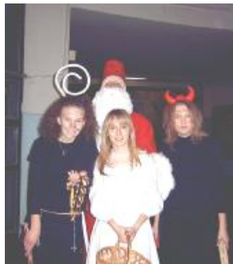
Mikuláš v podaní 3.C